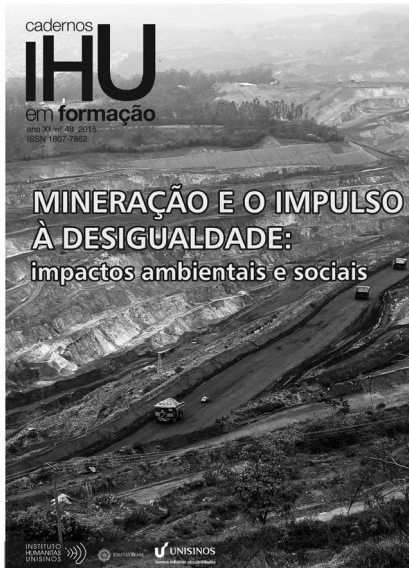
Nº 48 – Mineração e o impulso à desigualdade: impactos ambientais e sociais

Cadernos IHU em formação é uma publicação do Instituto Humanitas Unisinos – IHU que reúne entrevistas e artigos sobre o mesmo tema, já divulgados na revista IHU On-Line e nos Cadernos IHU ideias . Desse modo, queremos facilitar a discussão na academia e fora dela, sobre temas considerados de fronteira, relacionados com a ética, o trabalho, a teologia pública, a filosofia, a política, a economia, a literatura, os movimentos sociais etc., que caracterizam o Instituto Humanitas Unisinos – IHU.