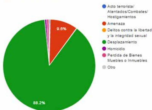
TERRITORIAL NARIÑO - 2015