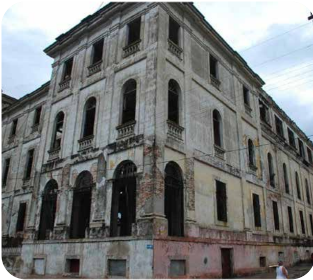
Estado actual de la fachada

Recientemente el edificio fue devuelto a la Compañía de Jesús en estado ruinoso, aunque su estructura se ha conservado en relativo buen estado gracias a la solidez constructiva, sobre todo del último nivel que tiene paredes y techo de hormigón.