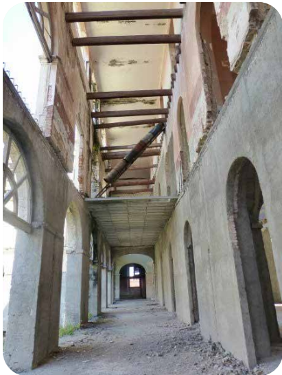
Corredor que colinda con el patio central