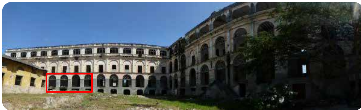
Vista panorámica del edificio desde el patio central.

• aulas para ofrecer servicios formativos y otras actividades a jóvenes, adolescentes y laicos.