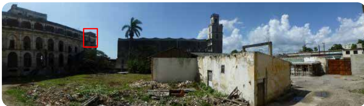
Vista panorámica del patio central. (Al fondo la Parroquia "Ntra. Sra. de Montserrat").

Cuenta además con espacios de parqueo bajo techo, otro patio auxiliar, un local destinado a salón así como locales varios.