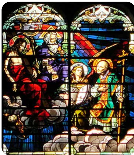
Detalle de la “Glorificación de San Ignacio”. Vitales de la Parroquia de Reina.