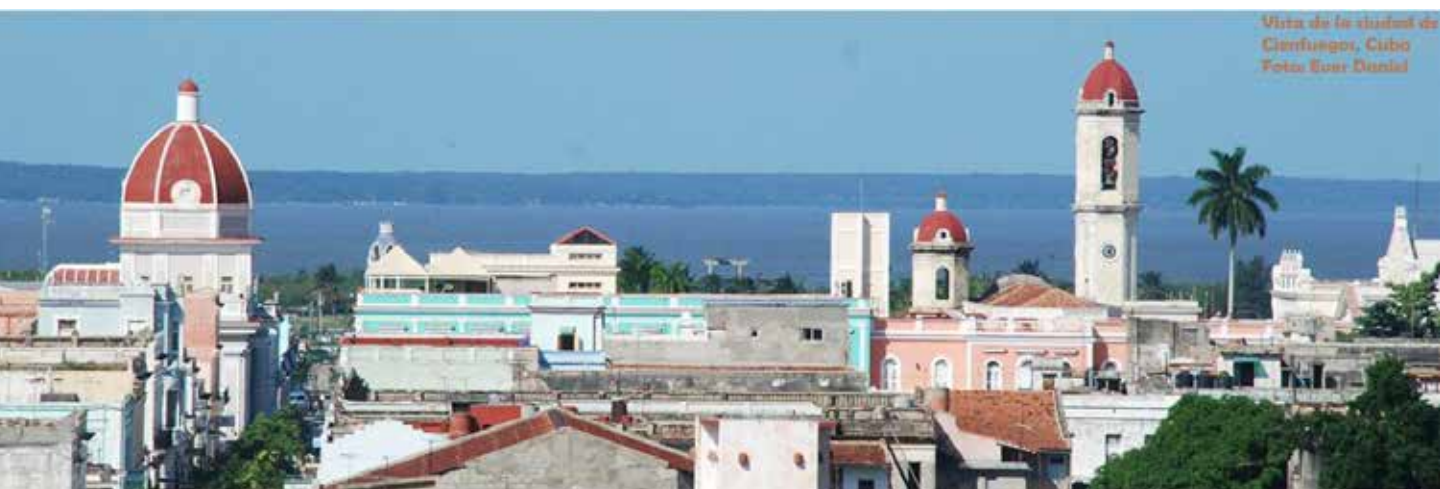
Vista de la ciudad de Santiago, Cuba